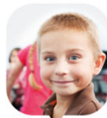
S DVOJÍ VÝJIMEČNOSTÍ